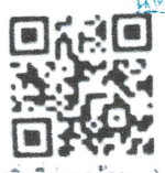
(สิ่งที่ส่งมาด้วย ๑)