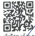
(สิ่งที่ส่งมาด้วย ๒)

ที่ทำการปกครองอำเภอ กลุ่มงานบริหารงานปกครอง โทร./โทรสาร ๐ ๔๔๖๒ ๘๑๑๙